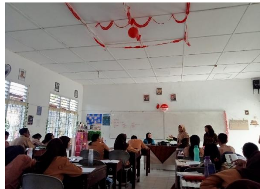
Gambar 2. Penyampaian materi ide & peluang usaha