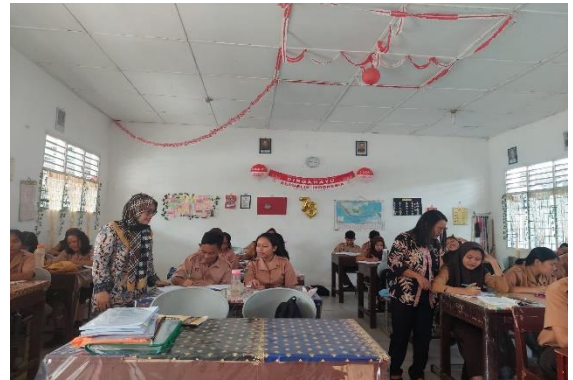
Gambar 4. Sesi Diskusi tanya jawab