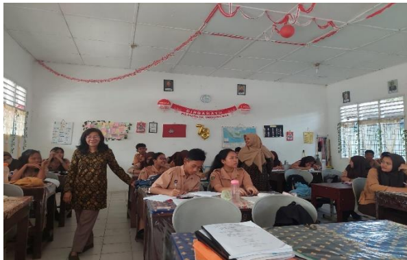
Gambar 3. Penyampaian materi Kewirausahaan