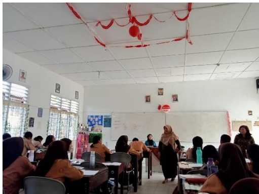
Gambar 1. Pembukaan

Kegiatan Pengabdian masyarakat ini dilaksanakan pada hari Sabtu 17 Mei 2025, pukul 09.00 – 12.00 WIB bertempat di Aula SMU Yapim. Kegiatan ini berupa pemberian pemahaman mengenai membangun ide bisnis dan melihat peluang usaha awal untuk siswa. Berikut ini gambar kegiatan pelaksanaan kegiatan pengabdian masyarakat